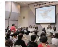
工賃向上フォーラム

企業、経済団体、市民・社会セクター、行政等の様々な団体との連携により、「工賃向上」というメッセージを社会に向けて発信し続けます。また、障害者施設・事業所のネットワーク化を図り、相互の情報交換と地域に向けた情報発信を行っています。