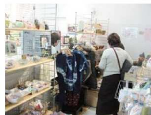
はーとふるメッセ美浜店